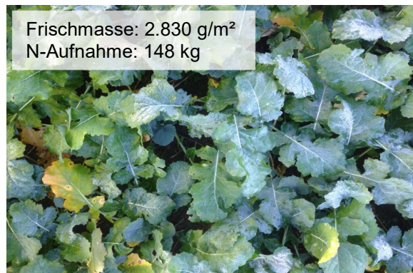
Abb. 1: N-Aufnahme von Rapsbeständen bis Vegetationsruhe (oben)